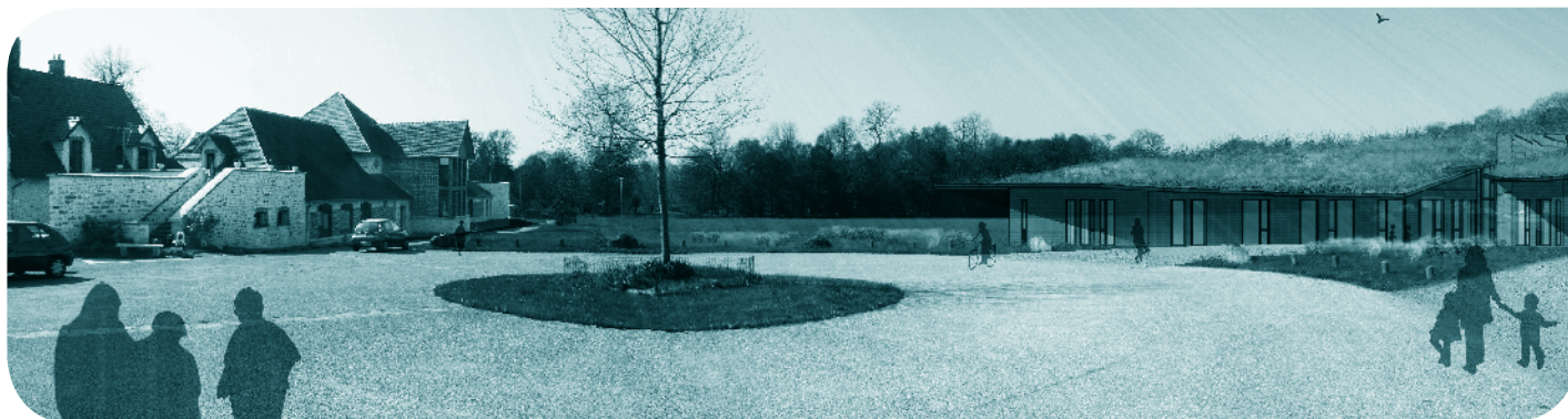
Projet de Pôle Petite Enfance - Domaine de Soucy

Implanté dans le domaine de Soucy, le futur pôle petite enfance comprendra un Relais Assistantes Maternelles, un accueil de loisirs sans Hébergement (ALSH) pour les 3-5 ans de 80 places et un multi accueil pour les 0-3 ans de 40 places.