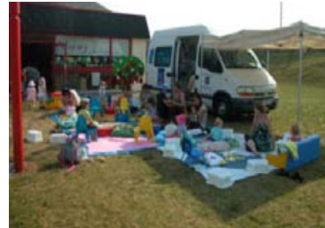
Formation le livre et les bébés avec l'association ACCES