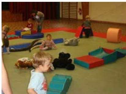
Psychomotricité à Saint Maurice-Montcouronne