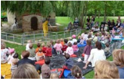
Spectacle dans le parc de Soucy

Selon les demandes des assistantes maternelles, des thèmes sont développés par des propositions de formations, conférences, l'achat de livres et revues et une collaboration avec les professionnels des structures collectives qui le souhaitent lors de projet regroupant tout le territoire, comme en mars 2010 « la semaine de la petite enfance » avec les accidents domestiques, en octobre le « salon des auteurs » organisé par le service culturel et prochainement le week-end « Festijoux » qui se déroulera dans la gymnase de Briis-sous-Forges.