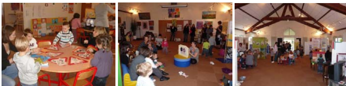
Accueil des scolaires

- Des conférences et ateliers de formations, sur les thèmes du livre, de l'illustration d'albums et de leur choix, ainsi que sur les accidents domestiques et les bonnes postures à adopter pour conserver un dos en état, lorsque l'on travaille ou vit quotidiennement avec des enfants.