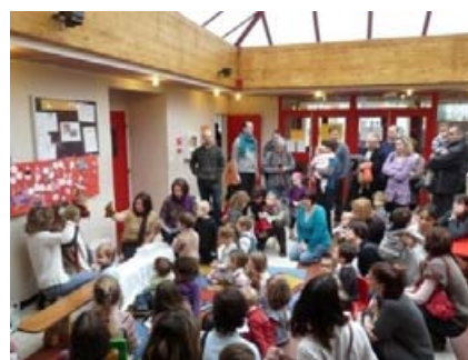
Galette des rois – Janvier 2010

En 2002, le premier Relais Assistantes Maternelles a ouvert ses portes.