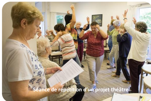
Séance de répétition d'un projet théâtre

✉ agnescottais@gmail.com / viequotidiennedhier@gmail.com