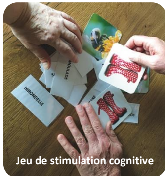
Jeu de stimulation cognitive