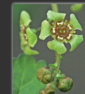
Groseillier à grappes