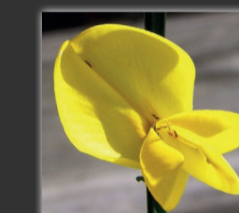
Genêt à balais