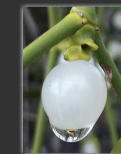
Gui des feuillus