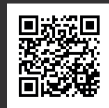
Exemple de QRcode