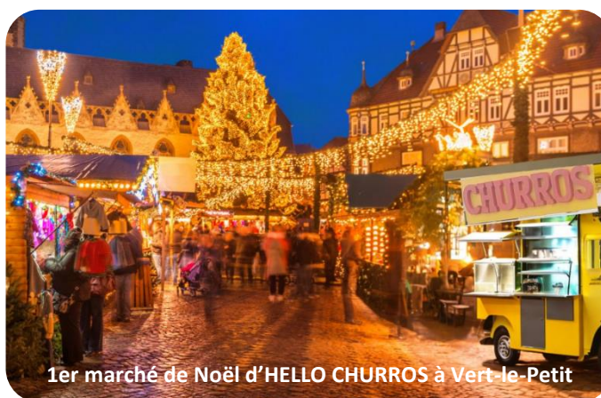
1er marché de Noël d'HELLO CHURROS à Vert-le-Petit