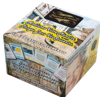
Jeu de mémoire Plaisir d'Antan