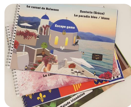
Livret Escape game