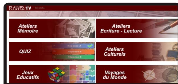
Interface de la plateforme vidéo Plaisir d'Antan TV