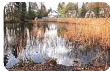
Etang des Aulnettes