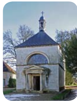
Parc du Château de Courson